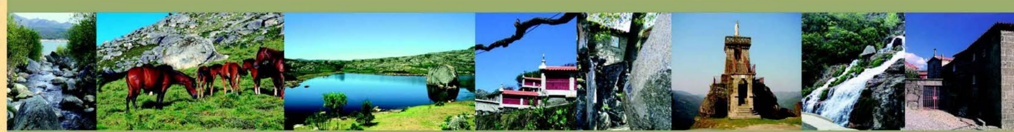
> Vilarinho das Furnas (C7) > Serra do Gerês > Serra do Gerês > Espigueiros de Cortinhas - Brufe (C6) > Cotele - Cibões (CS) > Bom Jesus das Mós (D5) > Vilarinho das Furnas (C7) > Casa dos Bernardos (HS)